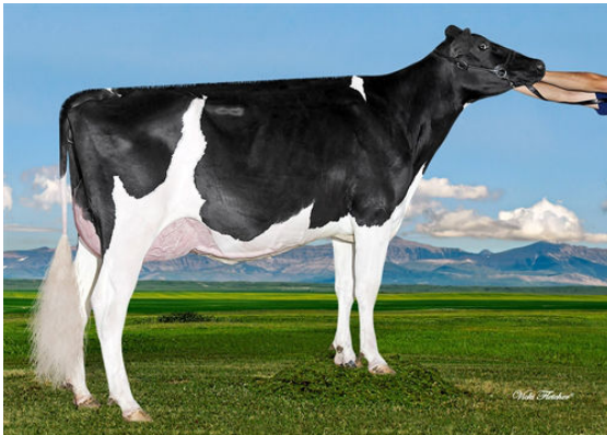
BGP MODESTY IMOGENE DAM